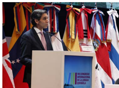
Visita SS. MM. Los Reyes de España | Eventos relacionados