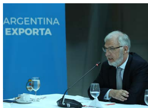
Visita SS. MM. Los Reyes de España | Eventos relacionados