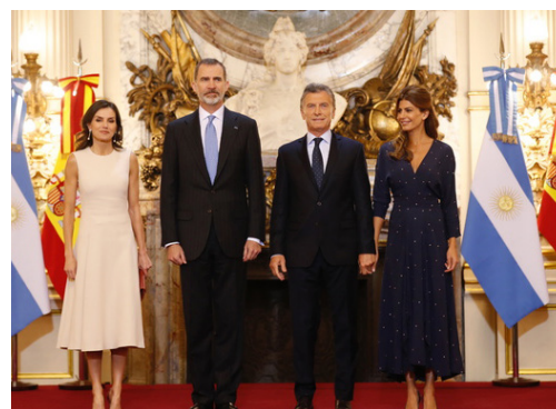
Nota de Tapa | Viaje de Estado a la República Argentina

23 | Notisocios Novedades de nuestras empresas asociadas.